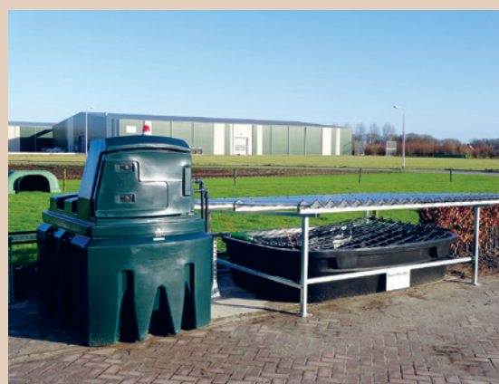
Le système Phytobac® est modulable, Beutech Agro