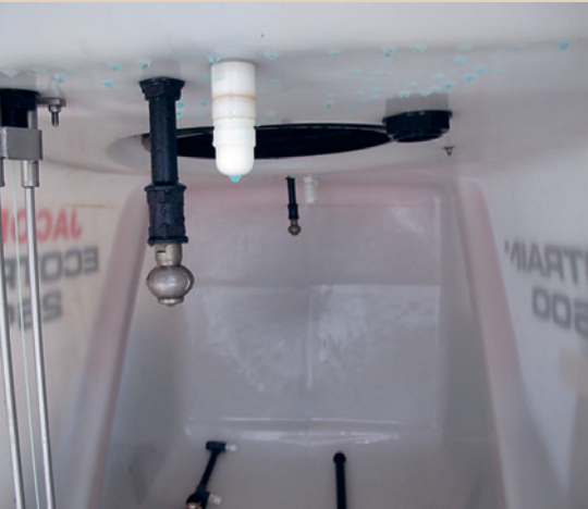
Cuve de pulvérisateur avec buse de rinçage intérieure, agrotop