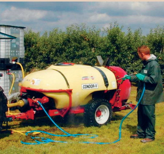
Nettoyage d'un turbodiffuseur sur une surface enherbée, TOPPS

Amélioration d'un poste existant: la place est souvent l'élément le plus cher de l'installation. Beaucoup d'exploitations, d'entreprises de travaux agricoles, etc., disposent de postes de lavage pour le rinçage des machines ou de places couvertes sous des avant-toits, des hangars à machines, etc. Il est possible d'étudier l'aménagement de tels postes demandant un minimum de travaux pour le nettoyage des pulvérisateurs. Les exigences peuvent varier en fonction des cantons (toit, séparation des eaux de pluie, etc.). Il conviendrait donc de consulter le service cantonal compétent (service de la protection des eaux) dès le stade de la planification.