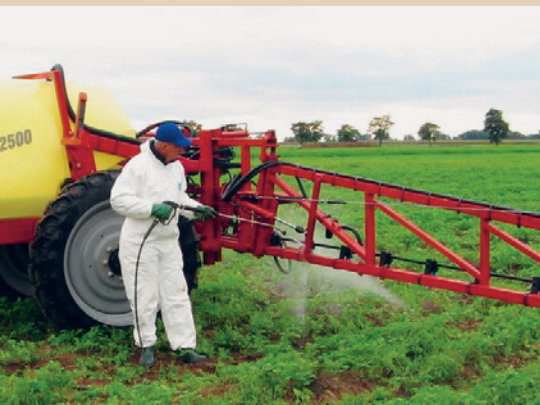
Nettoyage d'un pulvérisateur agricole à l'aide d'un jet haute pression, TOPPS