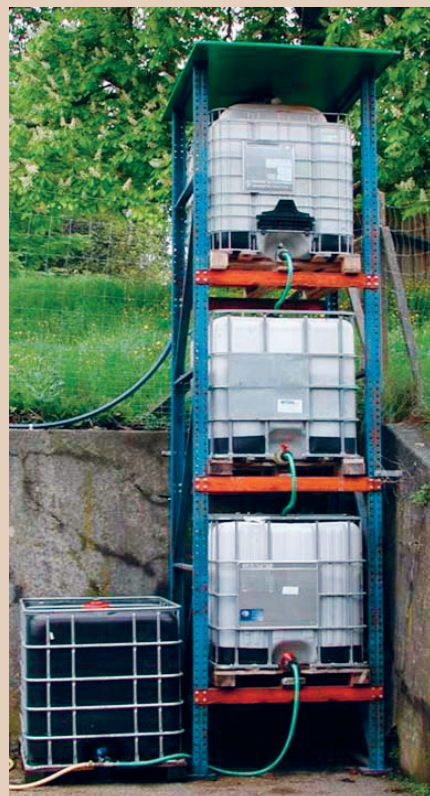
Le système de biofiltre est intéressant, si on utilise l'eau filtrée pour l'arrosage, AGRIDEA