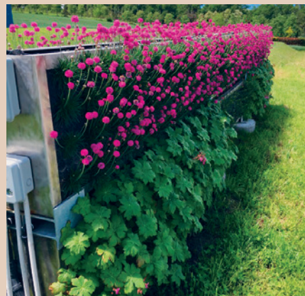
Le système VG Biobed™ occupe peu de surface au sol. Installation à Bernex GE, ecaVert

Installation de référence : Luc Magnollay, 1163 Etoy VD, culture fruitière, capacité 10 m 3 /an