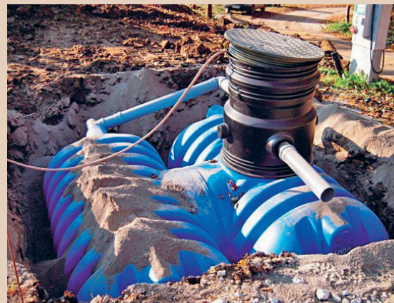
Une cuve de rétention enterrée est à l'abri du gel, mais elle doit impérativement être équipée de doubles parois, L. Chevalier

Fosses à purin inutilisées: une fosse à purin qui n'est plus utilisée est en général verrouillée et il n'est pas permis d'y entreposer de l'eau de rinçage. Elle ne satisfait pas aux prescriptions légales réglant le stockage des liquides pouvant altérer les eaux (double paroi).